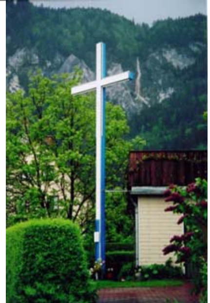
eines der rund 7'000 "Liebeskreuze" in Europa

Es mutet eigenartig an, wenn der Bundesrat von der "Bedeutung der Kirchen in der Wertediskussion" der Gesellschaft spricht. Natürlich, faktisch haben die Kirchen eine Bedeutung, deshalb müssen sie vor allem in die Pflicht genommen werden. Einen besonderen Beitrag haben sie aber – das zeigen die jüngere und ältere Geschichte – nicht geleistet, im Gegenteil: Wie Leuenberger bemerkt, haben gerade in den jüngsten Konflikten die Kirchen und die Religionsführer einmal mehr ihre unheilvolle Rolle als göttliche Legitimationsverordner für kriegerisches Handeln demonstriert. Von solchen Leuten ist kein Beitrag zur