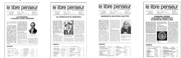
156 mars 2013 157 juin 2013 158 sept. 2013 159 déc. 2013